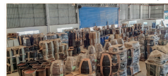
Centro de Distribuição