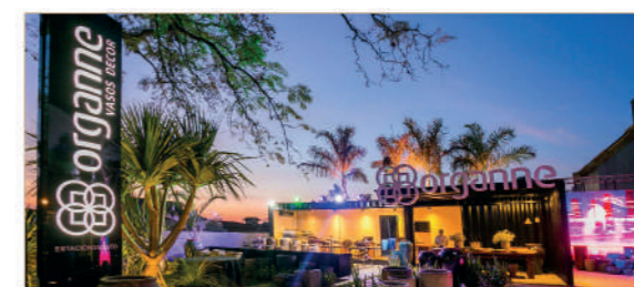
Maringá - PR