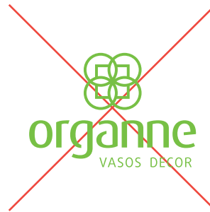
cores fora da paleta